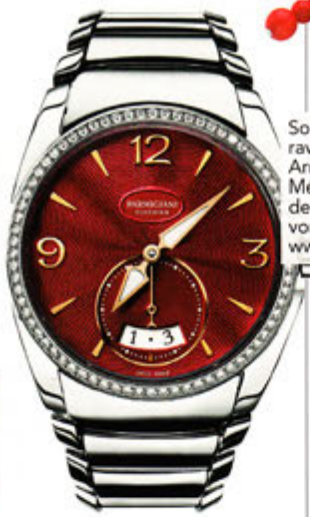
Sorgt für einen extravaganen Auftritt: Armbanduhr „Tonda Métropolitaine“ aus der „Métro Kollektion“ von Parmigiani Fleurier, www.parmigiani.ch