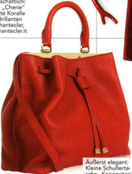
Äußerst elegant: Kleine Schultertasche „Kensington“ aus strukturiertem Leder von Mulberry, www.mulberry.com