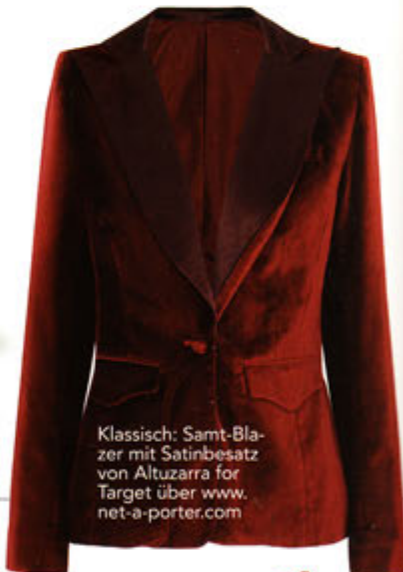
Klassisch: Samt-Blazer mit Satinbesatz von Altuzarra für Target über www.net-a-porter.com