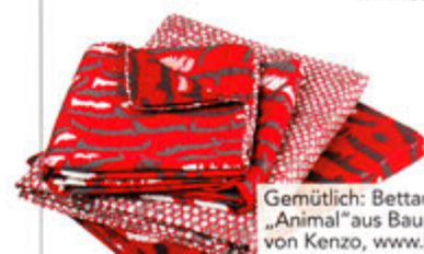
Gemütlich: Bettausstattung „Animal“ aus Baumwolle von Kenzo, www.kenzo.com