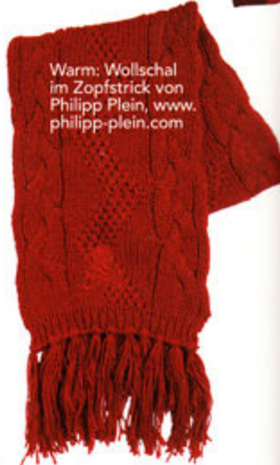
Warm: Wollschal im Zopfstrick von Philipp Plein, www.philipp-plein.com