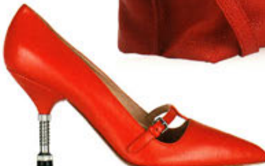
Schrauben-Absatz: Lederpumps „Mary Jane“ von Miu Miu, www.miumiu.com