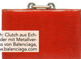
Ikonisch: Clutch aus Echenleder mit Metallverschluss von Balenciaga, www.balenciaga.com