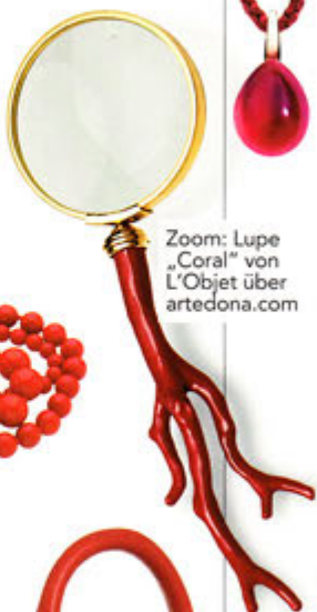
Zoom: Lupe „Coral“ von L'Objet über artedona.com