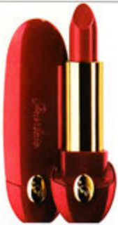
Fabulous: Lippenstift „Rouge G“ in „Parade“ von Guerlain, www.guerlain.com