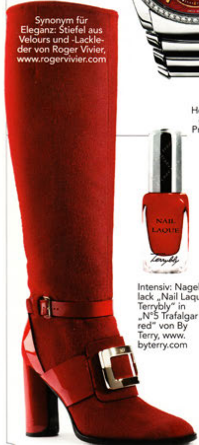
Synonym für Eleganz: Stiefel aus Velours und -Lackleder von Roger Vivier, www.rogervivier.com