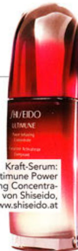
Kraft-Serum: „Ultimune Power Infusing Concentrate“ von Shiseido, www.shiseido.at