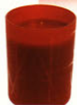
Geheimnisvoll: Duftkerze „Jaipur“ von NARS, www.narscosmetics.eu