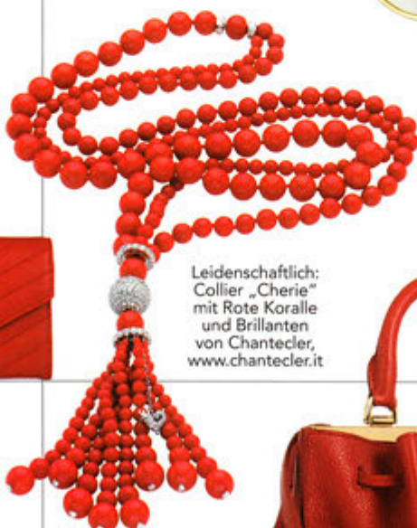
Leidenschaftlich: Collier „Cherie“ mit Rote Koralle und Brillanten von Chantecler, www.chantecler.it